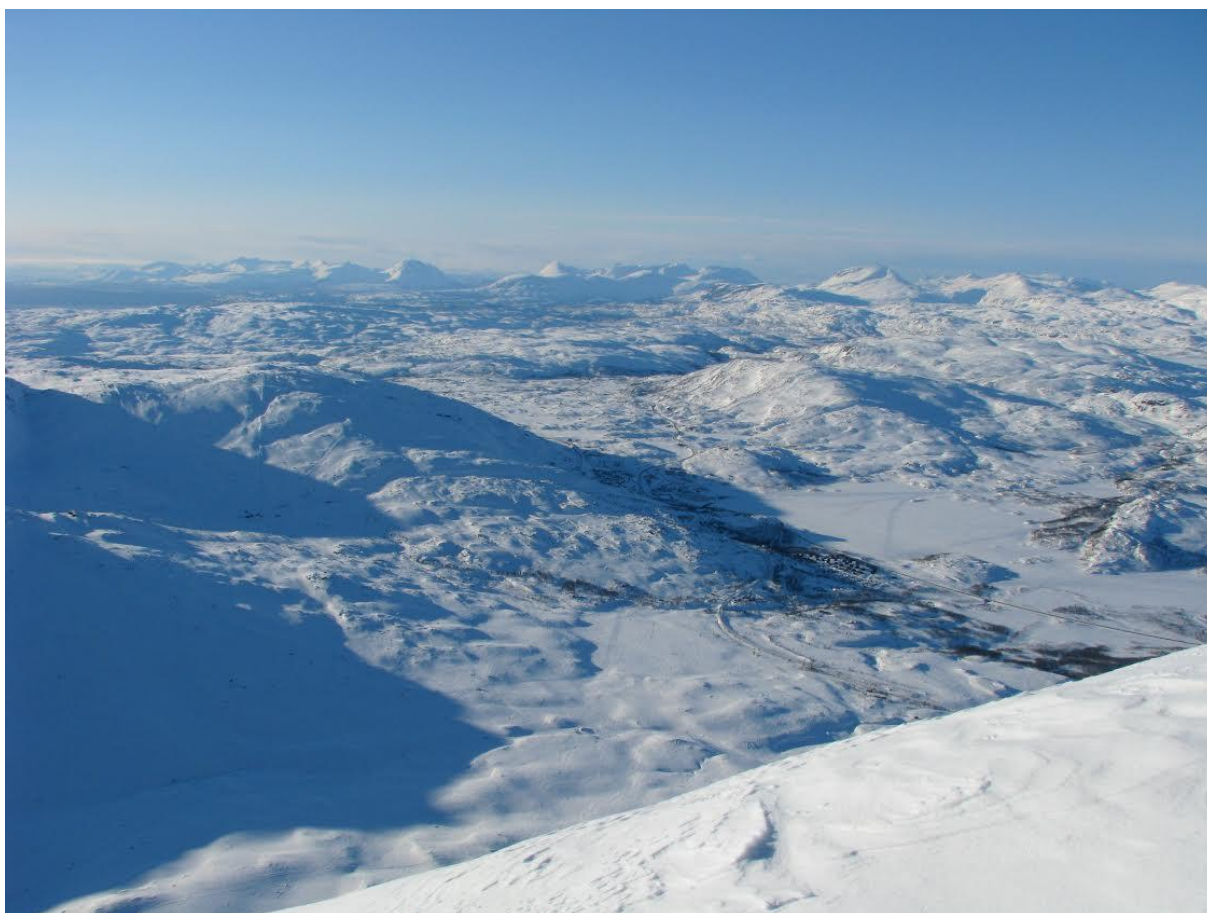
Vy från Vassitjåkka över Katterjokk och Riksgränsen. Hittar ni Turiststationen?

Fråga: Var finns närmaste skoteruthyrning?