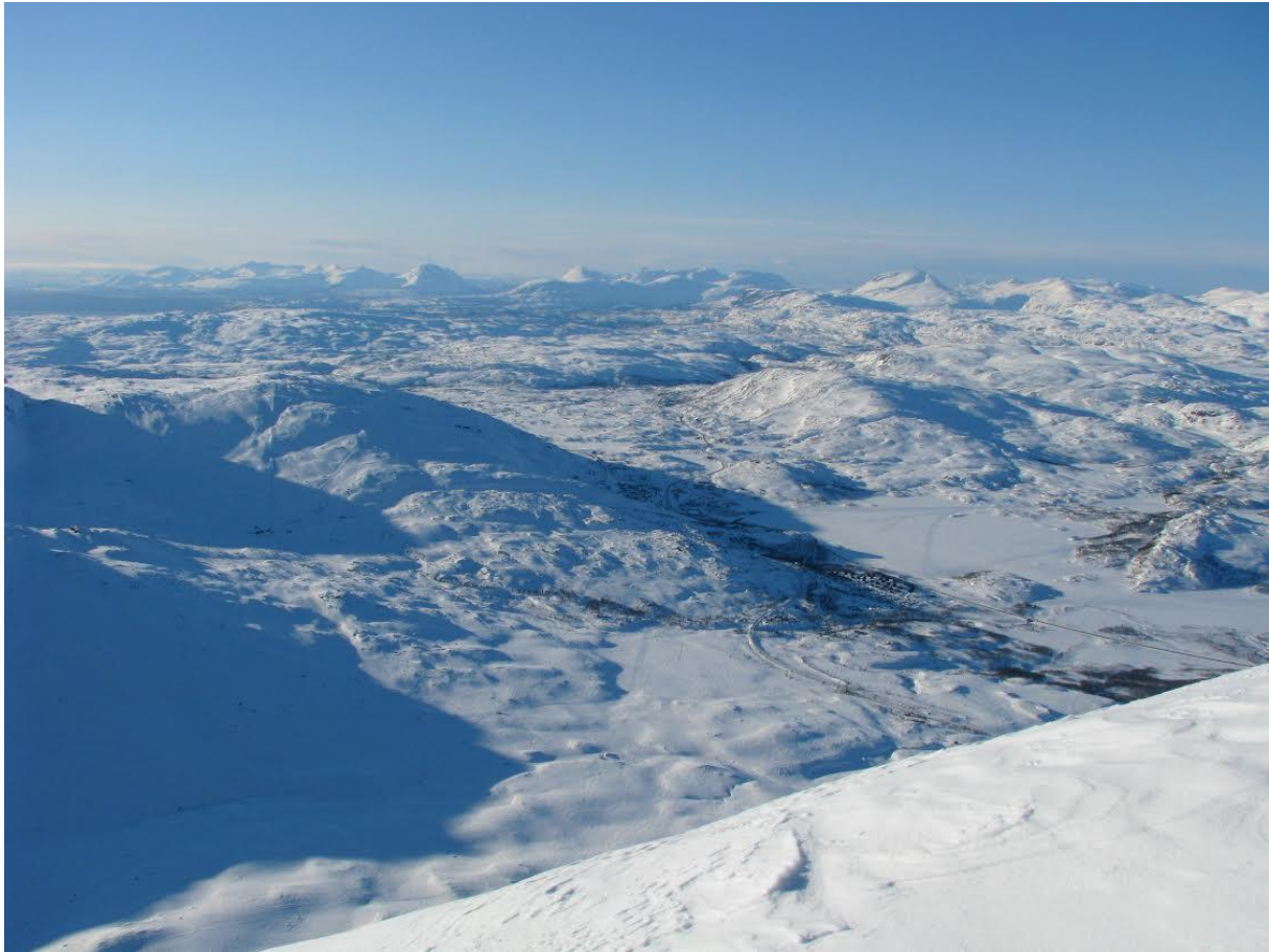
Vy från Vassitjåkka över Katterjokk och Riksgränsen. Hittar ni Turiststationen?

Fråga: Var finns närmaste skoteruthyrning?