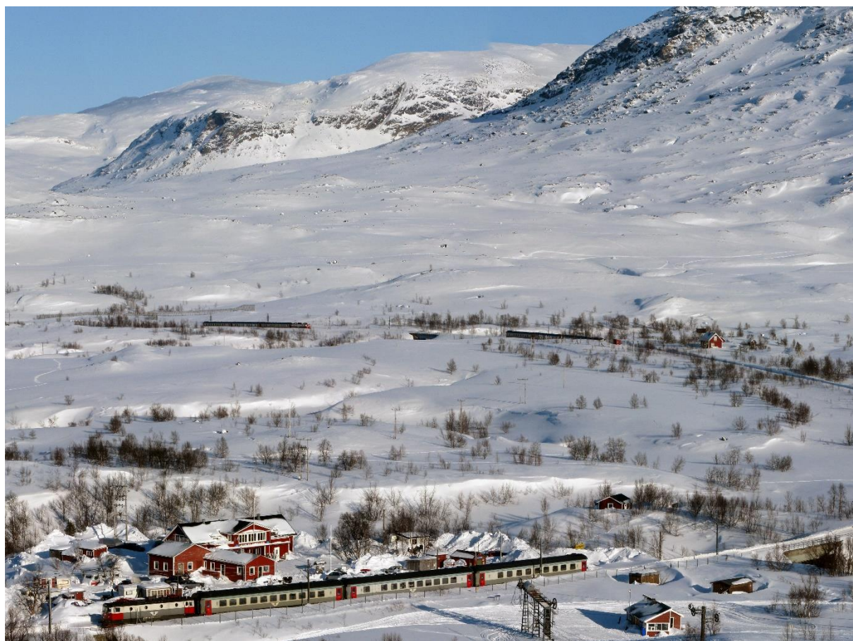
Vy över Turiststationen och liften (Riksgränsen)

Bilder på omgivningen kring Turiststationen: